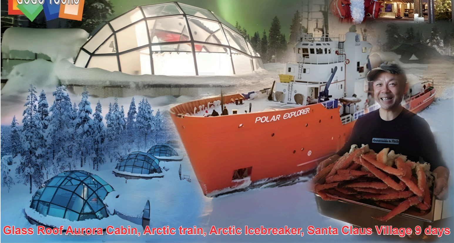
Glass Roof Aurora Cabin, Arctic train, Arctic Icebreaker, Santa Claus Village 9 days