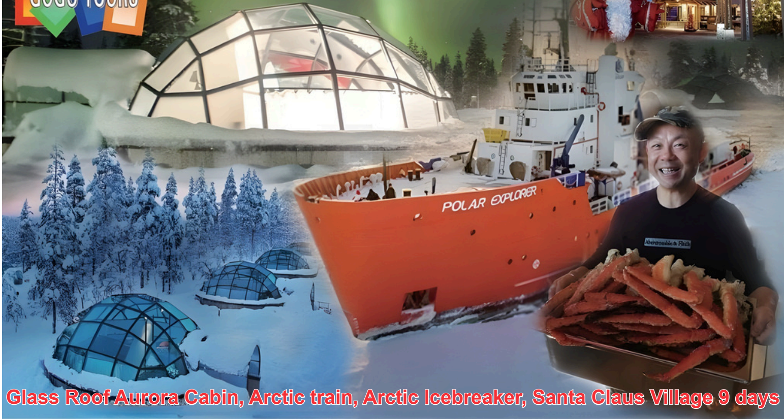
Glass Roof Aurora Cabin, Arctic train, Arctic Icebreaker, Santa Claus Village 9 days